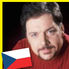
トマス・チェルニー (テノール)