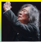
小林 研一郎(指揮)