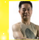
英哲風雲の会(和太鼓)