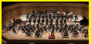
名古屋音楽大学シンフォニックウインズ