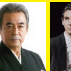
マルティン・ シュタットフェルト(ピアノ)