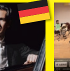
ガルガン・アンサンブル