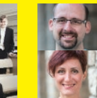
ハンガリー声楽アンサンブル