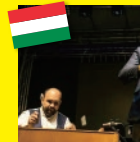
ハンガリー シャルコジ・ジブシー・フィーバー