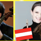
カリン・ボネッリ (フルート)