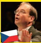
レオシュ・ スワロフスキー(指揮)