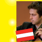
セバスティアン・ ブルー(チェロ)