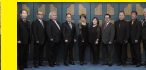
ザ・トランペットコンサート