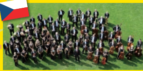
ヤナーチェク・フィルハーモニー 管弦楽団