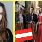
ウィーン チェロ・アンサンブル5+1