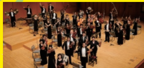
オーケストラ・アンサンブル金沢