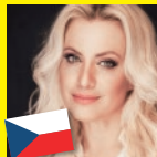
テレザ・マトロヴァ (ソプラノ)