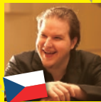
ルーカス・ ヴォンドラチェク(ピアノ)