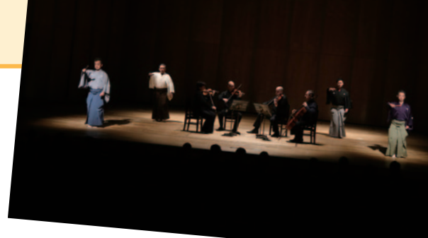
昨年の「能舞とベートーヴェン」公演。 今年ではモーツァルトのオペラと能舞がコラボする