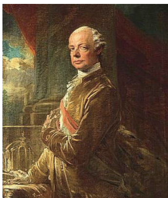
神聖ローマ帝国の皇帝レオポルト2世

毎年楽しみにしている人が多い、金沢名物の能舞とのコラボレーション。オペラに挑戦する今年は、登場人物それぞれの心理や苦悩がどう表現されるかに注目だ。