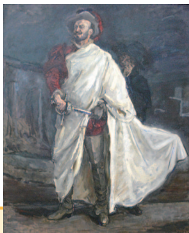
マックス・スレーフォークトが描いた「ドン・ジョヴァンニ」

ィガロの結婚」の成功を受けて、翌1787年にプラハで初演された。台本は同じくダ・ポンテによる。さまざまな劇や小説の題材となった、スペインの伝説の女たらし「ドン・ファン」をオペラ化したもの。ある夜、ドン・ジョヴァンニが騎士長の娘ドンナ・アンナを誘惑していたところ、騒ぎが起きて騎士長を殺してしまふ。しかし彼は懲りずに、従者レポレロを連れて女たらしの道を突き進む。復讐を誓うドンナ・アンナと許婚、何度捨てられてもドン・ジョヴァンニをあきらめないドンナ・エルヴィーラの3人が彼を追い詰めようとするも不発に終わり、この不遜が永遠に続くかと思われたその時、騎士長の霊が現れてドン・ジョヴァンニを地獄へ落とす。今回はこのオペラから珠玉のアリアが歌われる。豪華な歌手陣が難易度の高い曲にどう挑むか注目だ。