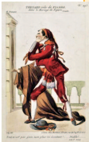
1807年、フィガロのコスチュームデザイン