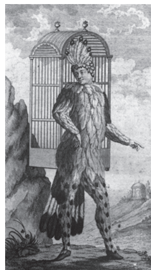
パバゲーノを演じる俳優・興行主のエマヌエル・シカネーダー