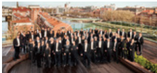
ブレーメン・フィルハーモニー管弦楽団(ドイツ)