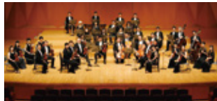
オーケストラ・アンサンブル金沢