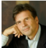
ヴォルフガング・ホルツマイアー