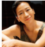
小山 実雅恵