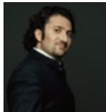
ミハイル・アグレスト