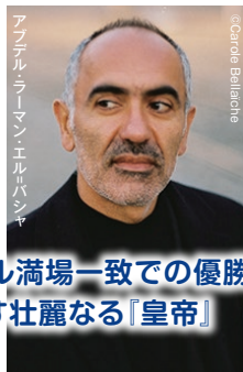
アプデル・ラーマン・エル＝バシャ (Abdel Rahman El Bacha)

エリザベート王妃コンクール満場一致での優勝! 天才エル＝バシャが描き出す壮麗なる「皇帝」