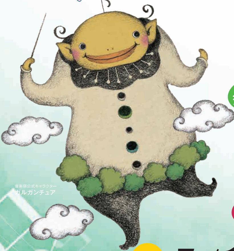
音楽祭公式キャラクター ガルガンチュア